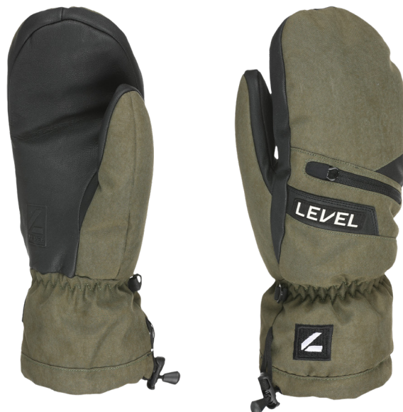
14 olive green