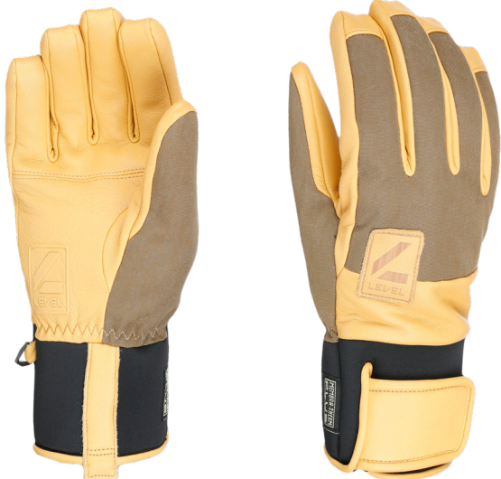
14 olive green