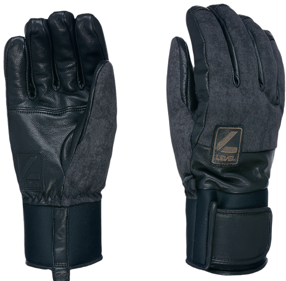
18 black grey

FIT: Natural MATÉRIEL: Cuir de chèvre imperméable ISOLATION: Multilayer Primaloft, Hydrofill TECHNOLOGIE IMPERMÉABLE: Membra-Therm Green VALEUR DURABLE: 5% Recyclé 45% Bio CARACTÉRISTIQUES: Manchette courte en néoprène, Fermeture Hook&loop, Laisse tempête