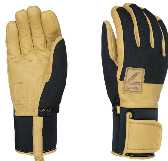
43 pk black