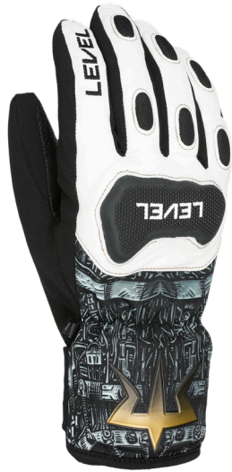
40 pk white