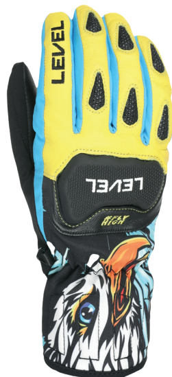
70 yellow blue