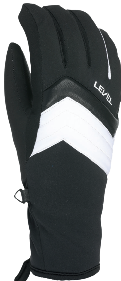
35 black white