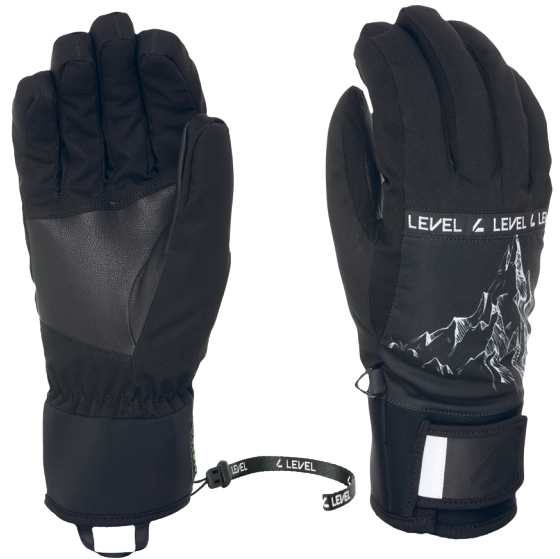
43 pk black