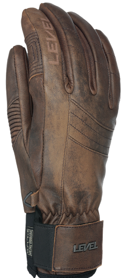
33 scottish brown