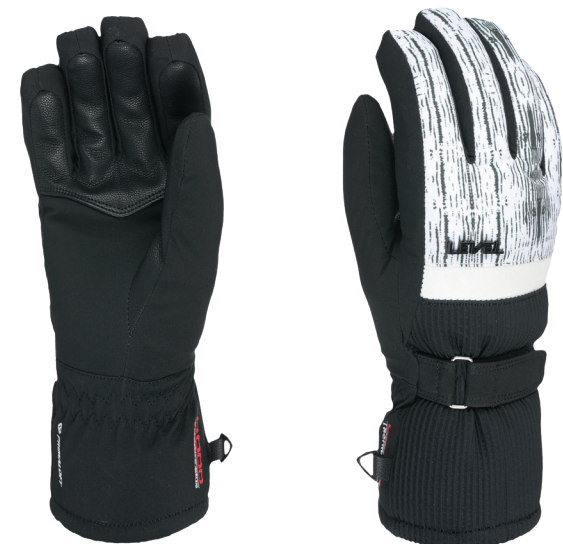
41 ninja black