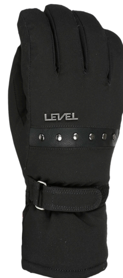
43 pk black