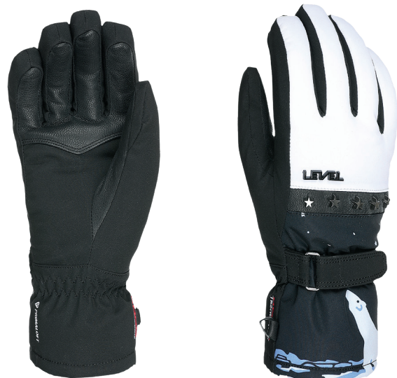
35 black white

FIT: Natural MATÉRIEL: Tissu résistant à l'eau, Paume en cuir de chèvre imperméable ISOLATION: Multilayer Primaloft, Doublure douce au toucher avec traitement Polygiene TECHNOLOGIE IMPERMÉABLE: Membra-Therm Plus CARACTÉRISTIQUES: Manchette avec fourrure à l'intérieur, Laisse tempête, Sangle réglable